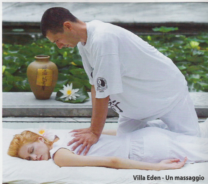
Villa Eden - Un massaggio

"Daremo ai nostri clienti la possibilità di fare corsi di yoga al mattino e massaggi Shiatsu in camera. In più proporremo menù macrobiotici. In questo modo l'hotel diventerà anche un luogo dove coccolarsi e prendersi cura del proprio benessere psico-fisico.